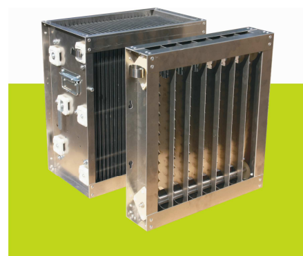
snadno dělitelný - 2 kusy při čištění filtru