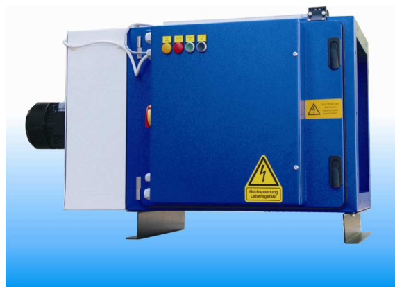
AEROFOG® KE velikost 1

Zařízení typu AEROFOG® KE je kompaktní filtrační zařízení s horizontálním průtokem odsávaného vzduchu. Toto zařízení je osazeno ventilátorovou jednotkou / výkonové parametry - viz tabulka /